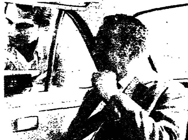
الرئيس كرامي... يولي بصرجه على حياز الصحافة

للمرة الاولى، يقوم الرئيس رشيد كرامي... وكان المقصود من الغياب تقييم الموقف والمطلوب الآن المساعدة في بناء الدولة والمؤسسات